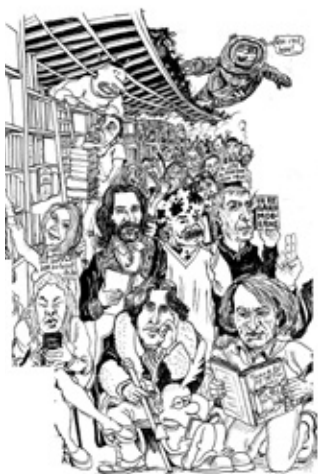
© Laurent Lolmède. Détail dessin en cours de réalisation.