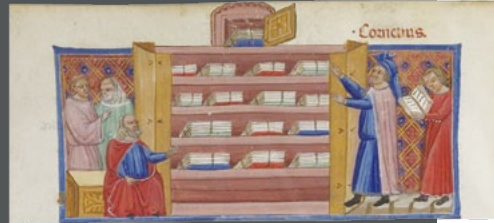
Le Roman de Troie , par « BENEVOIT DE SAINTE MORE » Bibliothèque nationale de France, Département des manuscrits, Français 782

Du latin armarium , ii, n ( arma ), armoire. Désigne un meuble dans lequel on rangeait les livres dans les bibliothèques romaines évoquées par Vitruve, Cicéron et Pline le Jeune.