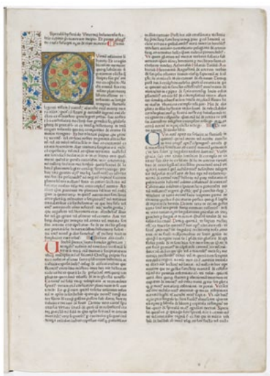
Speculum historiale par Vincent de Beauvais (1190?-1264) Incunable Réseau des médiathèques du Beauvaisis INC_01