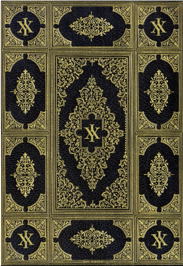
S'ensuyt le Bestiaire damours : moralisé sur les bestes & oyseaux le tout par figure et hystorie (couverture) Richard de Fournival Livre imprimé Bibliothèque du Musée Condé III-F-026