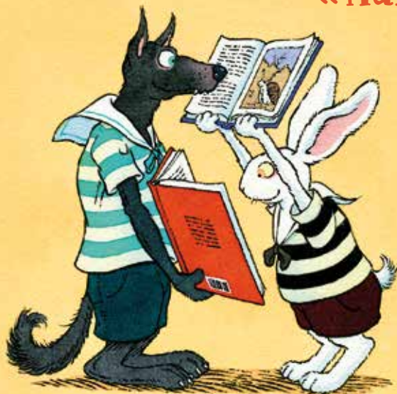
ILLUSTRATION: GILLES BACHELET

LECTURES, CONTES, EXPOSITIONS DANS LES BIBLIOTHÈQUES