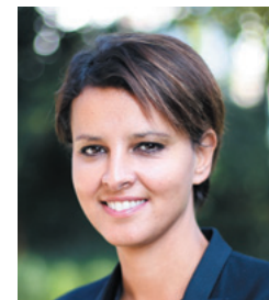
Najat Vallaud Belkacem ministre de l'Éducation Nationale, de l'Enseignement Supérieur et de la Recherche