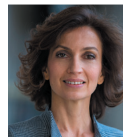
Audrey Azoulay ministre de la Culture et de la Communication

L'éducation artistique et culturelle n'est pas un domaine réservé. Ce n'est pas un luxe pour quelques privilégiés : c'est un bien commun, qui a vocation à être largement partagé. C'est une part essentielle dans l'apprentissage de l'autonomie d'un enfant, d'un adolescent, un élément clef dans sa formation en tant que personne et comme citoyen. Oui, l'éducation artistique et culturelle fait fond sur notre humanité, comme le rappelle Georges Steiner, lorsqu'il écrit que nous sommes, « un animal dont le souffle de vie est celui des rêves parlés, peints, sculptés et chantés » 1 . Cette conviction ne cesse de nous habiter et de nous porter au quotidien, et elle se traduit concrètement par la politique conjointe mise en œuvre par nos deux ministères en faveur de l'éducation artistique et culturelle.