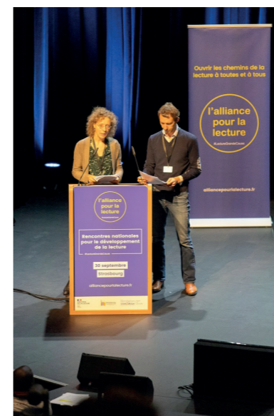
Synthèse des ateliers en région, Rencontres nationales pour le développement de la lecture, Strasbourg, 30 septembre 2022