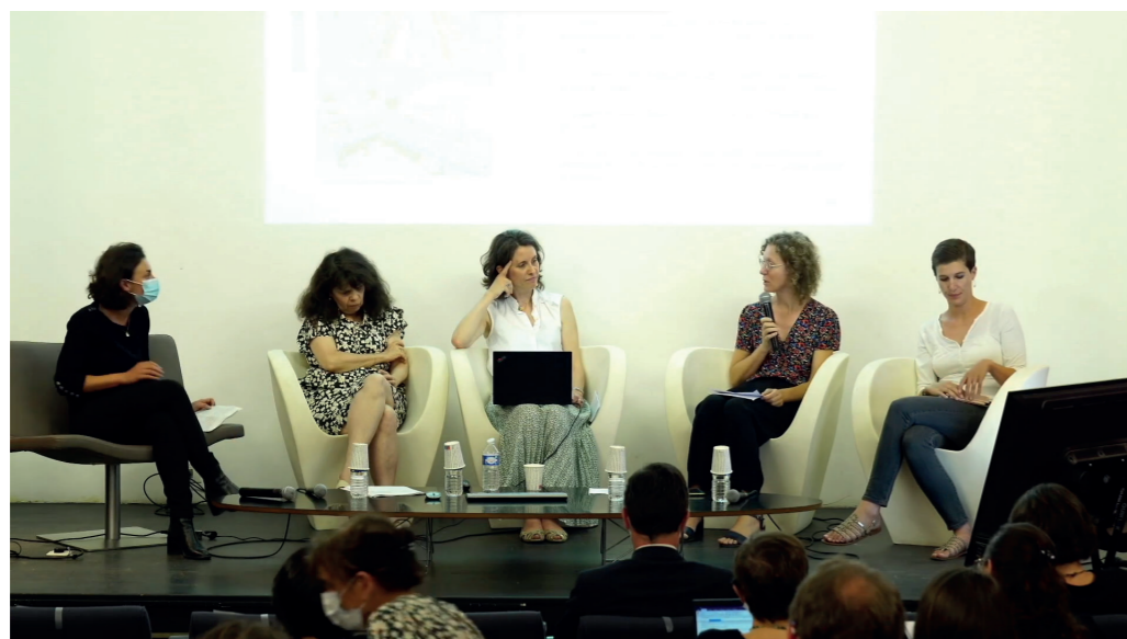
Table ronde « Quel avenir pour la conservation physique des collections de presse ? », Journées du patrimoine écrit, Rouen, 23 juin 2022 (capture d'écran)

5 décembre : animation de la table ronde « Changer d'échelle : la question de l'édition accessible pour tous » lors de la journée professionnelle du Salon du livre et de la presse jeunesse de Montreuil