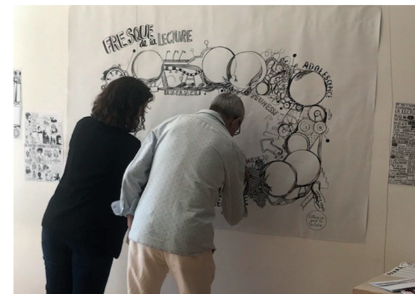
Atelier « Fresque de la lecture » sur une frise illustrée par Carole Chaix, Toulouse, 22 septembre 2022