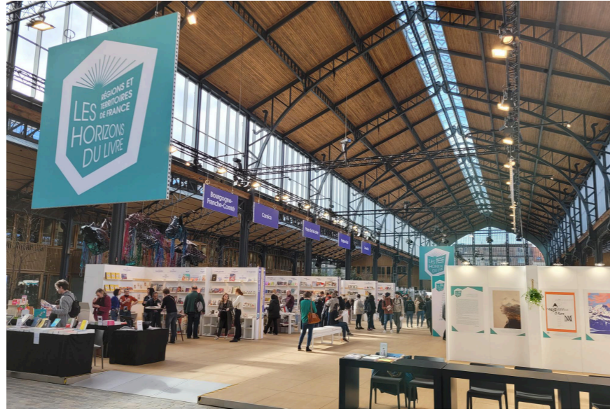
Vue d'ensemble du stand des régions et territoires de France, sous la nef de la Gare maritime, nouveau lieu d'implantation de la Foire du livre de Bruxelles.

Après des travaux préparatoires soutenus (réunions en visioconférences et partage de documents en ligne), coordonnés par la Fill à partir d'août 2022, les « Régions et territoires de France » ont été mis à l'honneur au cours de l'édition 2023 de la Foire du livre de Bruxelles.