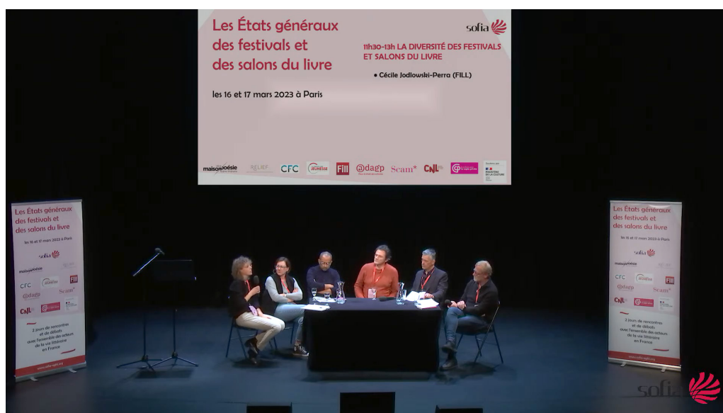
Delphine Henry (à gauche) lors de la table ronde « La diversité des festivals et salons du livre », États généraux des festivals et salons du livre, le 16 mars 2023 (capture d'écran)

7 septembre : présentation des ressources de la Fill aux 20 ans de l'Agence régionale du Livre Provence-Alpes-Côte d'Azur (Solène Bouton et Delphine Henry)