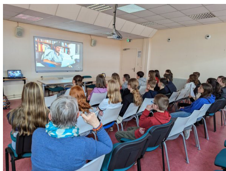
Atelier avec l'auteur Thierry Moral, dans les Hauts-de-France